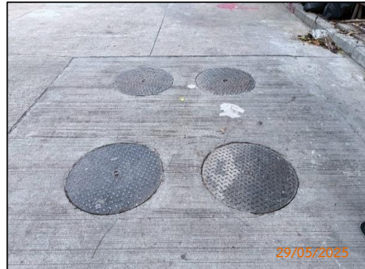
(ข) บ่อเกรอะ