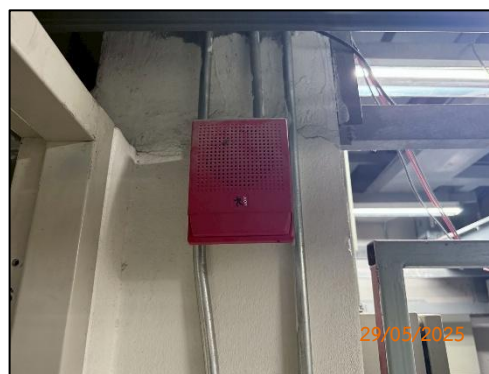
(ซ) ระบบประกาศเตือน 4 ภาษา