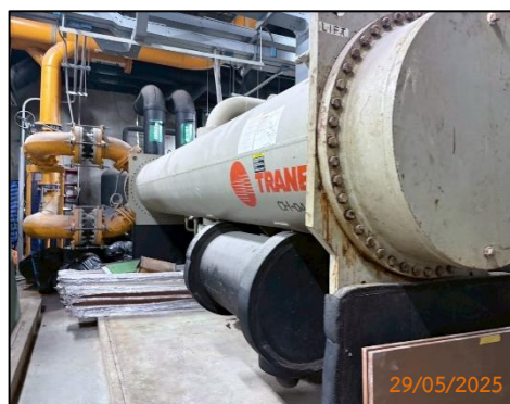
(ฉ) ระบบ GASS DETECTOR CONTROL