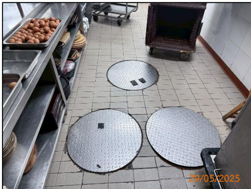
(ก) บ่อดักไขมัน

การติดตามตรวจสอบคุณภาพน้ำทิ้ง ระหว่างเดือนมกราคม-มิถุนายน พ.ศ. 2568 พบว่า การทำงานของบ่อดักไขมัน และบ่อเกรอะของโรงแรมเซ็นทาราแกรนด์มิราจบีชรีสอร์ท พัทยา สามารถบำบัดน้ำเสียเบื้องต้นได้ตรงตามจุดประสงค์อย่างมีประสิทธิภาพ มีการตรวจสอบการทำงานของบ่อดักไขมัน โดยตรวจดูปริมาณไขมันในบ่อ และดักไขมันในบ่อดักไขมันทุกบ่อของโรงแรมทั้งเป็นประจำทุกสัปดาห์ และมีการตรวจสอบการทำงานของบ่อเกรอะโดยว่าจ้างเทศบาลเมืองพัทยาเข้ามาสูบน้ำทิ้งในบ่อเกรอะทุกบ่อของโรงแรมเป็นประจำทุกเดือน (ภาคผนวก จ และภาคผนวก ฉ และรูปที่ 3-1)