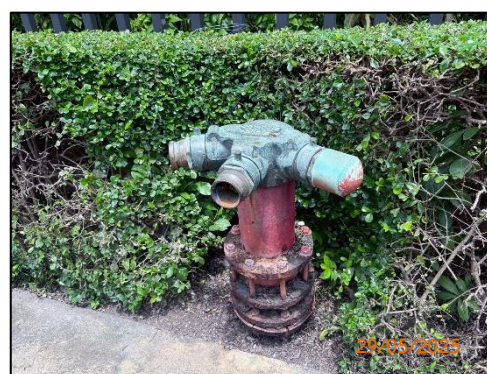
(ง) หัวจ่ายน้ำดับเพลิง