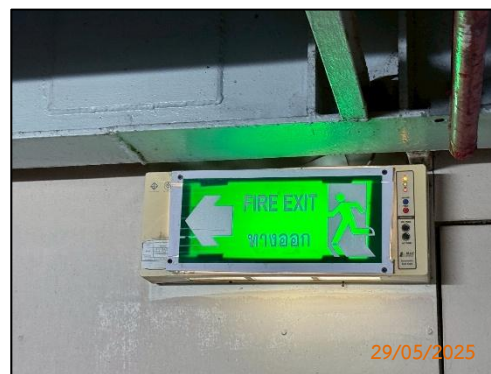
(ฑ) ป้ายแสดงเส้นทางหนีไฟ