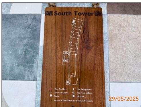
(ฐ) แผนผังแสดงเส้นทางหนีไฟ และตำแหน่งอุปกรณ์ดับเพลิงหน้าลิฟต์