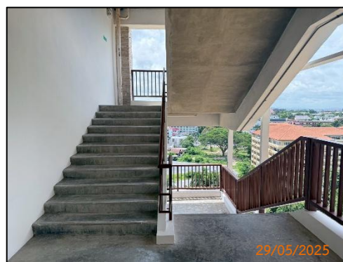
(ญ) บันไดหนีไฟ