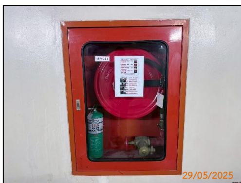
(ก) ตู้เก็บอุปกรณ์ดับเพลิงภายในอาคาร

สำหรับระบบการป้องกันอัคคีภัยทั้งภายใน และภายนอกโรงแรม มีการติดตั้งอุปกรณ์ตรวจจับเพลิงไหม้ แผนที่แสดงเส้นทางหนีไฟ อุปกรณ์ป้องกันอัคคีภัย ระบบไฟสำรอง ระบบไฟฟ้าฉุกเฉิน และระบบประกาศเตือน 4 ภาษา เมื่อเกิดเพลิงไหม้ภายในห้องพักทุกห้อง ทางเดิน และส่วนพนักงานทั้งหมด ติดตั้งป้ายสะท้อนแสงแสดงเส้นทางหนีไฟ ไฟสำรองฉุกเฉิน และอุปกรณ์ดับเพลิงภายในอาคารบริเวณทางเดินทุกชั้น และทำการตรวจสอบระบบป้องกันอัคคีภัย และอุปกรณ์ดับเพลิงเป็นประจำทุกเดือน รวมทั้งมีแผนการฝึกอบรมและซ้อมหนีไฟให้แก่พนักงานทุกระดับเป็นประจำทุกปีในช่วงระหว่างเดือนมกราคม-มิถุนายน พ.ศ. 2568 (ภาคผนวก ฉ และ รูปที่ 3.2)