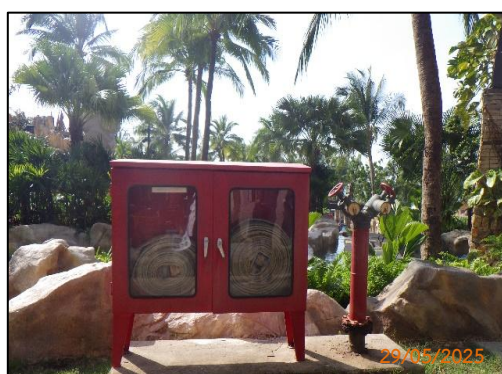
(ค) ตู้เก็บอุปกรณ์ดับเพลิงภายนอกอาคาร