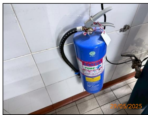
(ข) ถังดับเพลิง