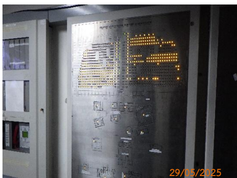
(จ) ระบบแจ้งเตือนเหตุเพลิงไหม้