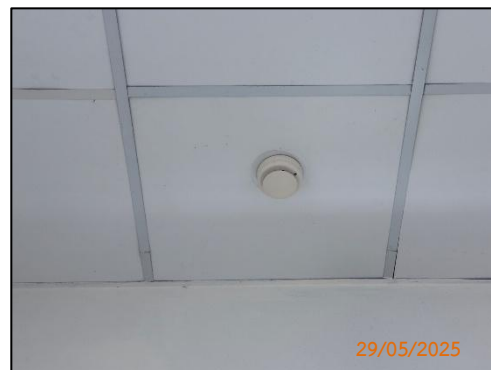
(ฏ) อุปกรณ์ตรวจจับควัน