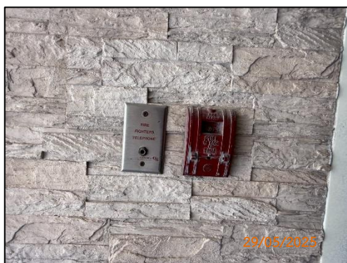
(ช) สัญญาณแจ้งเหตุไฟไหม้