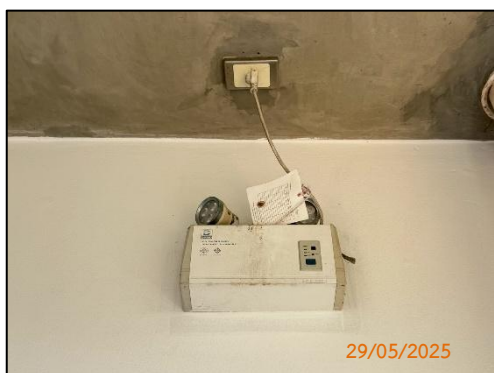
(ณ) ไฟฉุกเฉิน